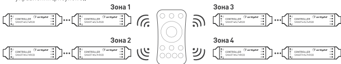
Рисунок 3. Вариант построения системы с 4-зонным пультом дистанционного управления