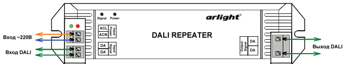
Рис.1. Назначение клемм.

3.3. Подключите провода шины DALI ко входу и выходу усилителя. Назначение разъемов и соответствие контактов показано на Рис.1.